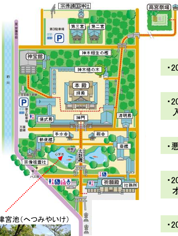
辺津宮池(へつみやいけ)